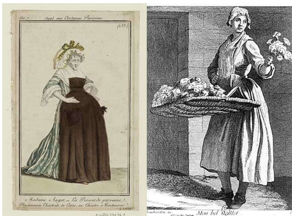
Izquierda. Madame Angot ou la Poissarde parvenue (Musée Carnavalet). Derecha. Mon bel Œillet. Études prises dans le Bas Peuple ou les Cris de Paris, Troisième suite (1738)

Por último, el término régratières – emparentado con el castellano “regatear” – se refería a las revendedoras, también conocidas en lengua provenzal de Marsella como repetieros . En castellano encontramos equivalentes como las regatonas, atravesadoras y chalanas, revendedoras de comestibles que tenían una reputación negativa y eran perseguidas por las autoridades, que consideraban que su comercio irregular encarecía el precio final de los bienes de consumo 18 .