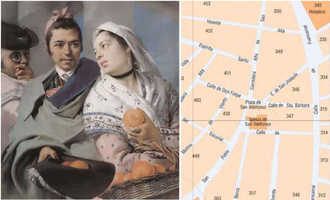
Izda.: Naranjera de Madrid (Lorenzo de Tiepolo). Dcha. Plazuela de San Ildefonso

Junto a las quejas contra la policía, las verduleras de San Ildefonso mostraban su descontento por el precio de las subsistencias. En diciembre de 1825, cuando los mercados despertaron con la noticia de la subida del pan, las mujeres de la plazuela de San Ildefonso acusaron al corregidor, porque “tenía parte en una contrata de trigo”. “Los pobres – amenazan las mujeres - siempre tendremos que aguantar hasta que se nos hinchen las narices, que entonces puede que se lo lleve todo el diablo” 44 . A la hora de buscar responsabilidades, las mujeres no sólo señalaban al corregidor sino también a Fernando VII, diciendo “si el rey no manda ahorcar a media docena de tahoneros, lo tendremos nosotras que hacer, ya que no hay justicia” 45 . Pero la politización realista había introducido novedades en el discurso popular sobre la carestía. No sólo se responsabilizaba a las autoridades, los comerciantes y los panaderos, sino que se aseguraba, “que los negros [liberales] tienen la culpa, pues que como la mayoría de ellos es rica, tienen muchos trigos almacenados y los quieren vender caros para incomodar a los realistas” 46 .