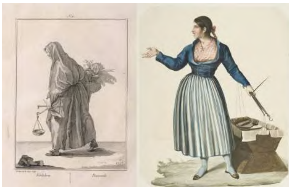
Imagen 2: Verdulera y vendedora

Izda.: Verdulera / Poissarde . Juan de la Cruz Cano y Olmedilla, Colección de Trajes de España tanto antiguos como modernos que comprehende todos los de sus dominios , Madrid, Casa de M. Copin, 1777. Dcha.: Vendedora , Antonio María Esquivel y Suárez de Urbina, ca.